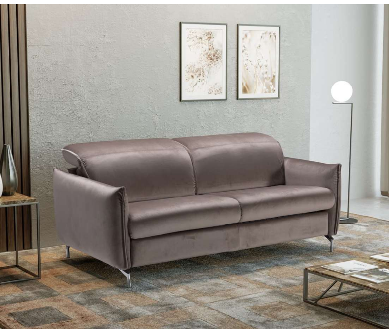
IN FOTO: RIVESTIMENTO IN TESSUTO; PIEDI IN ACCIAIO.