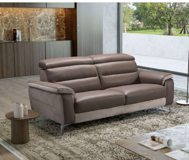
IN FOTO: DOPPIO RIVESTIMENTO pelle e tessuto (a richiesta, vedi foto pagg. 66-67) PIEDI IN ACCIAIO.